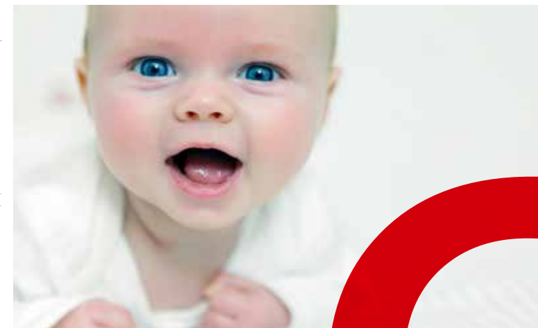
Abb.: © S1. (u.) Fotolia: 95186247-Subscription-Monthly-XXL

— Klinikum St. Georg gGmbH Akademisches Lehrkrankenhaus der Universität Leipzig Delitzscher Straße 141 | 04129 Leipzig