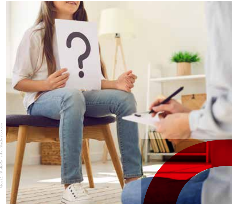
Abb. S.1